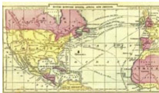
Gamalt kort af siglingarleiðum á Atlandshafi.

Þetta notfærðu Danakonungar sér til að hrista verslunareinokun Hansakaupmanna af ríki sínu. Danakonungar reyndust einnig hafa bolmagn til að úthluta Hansakaupmönnum verslun á ákveðnum höfnum hér og að sjálfsögðu gegn gjaldi. Leigutíminn var stuttur og sérhverjum kaupmanni var einungis heimilt að versla á tiltekinni