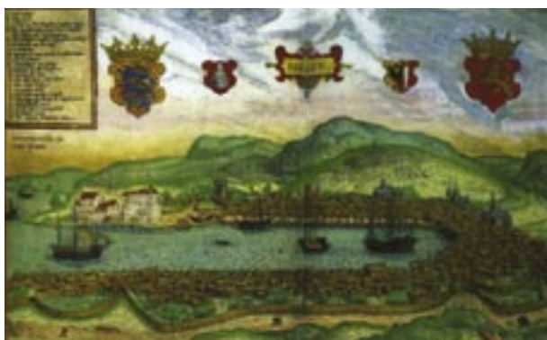
Gömul mynd frá Björgvin í Noregi

Noregur var aðalviðskiptalandið á þjóðveldisöld og fram um 1400. Ólafur kyrri Noregskonungur stofnaði til kaupstaðar í Björgvin um 1075. Þar myndaðist fljótlega vísir að verslunarstétt og varð bærinn miðstöð Íslandsverslunarinnar í nokkrar aldir. Talið er að fæstir þessara kaupmanna hafi verslað fyrir eigin reikning, heldur hafi þeir verslað í umboði höfðingja og ef til vill kirkjunnar. Þessir aðilar höfðu yfir meira fjármagni að ráða en Íslendingar og gátu tekið á sig þá áhættu sem fylgdi úthafssiglingum.