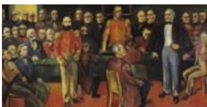
Frá Þjóðfundinum 1851.

Danska stjórnin tók verslunarmálið upp nokkru eftir að Þjóðfundinum var slitið. Hún lagði málið fyrir danska ríkisþingið er samþykkti lög sem veittu Íslandi algert verslunarfrélsi frá og með 1. apríl 1855. Íslendingar lýstu yfir óánægju sinni með þessa málsmeðferð en töldu þó meira máli skipta að orðið hefði verið við óskum lands-