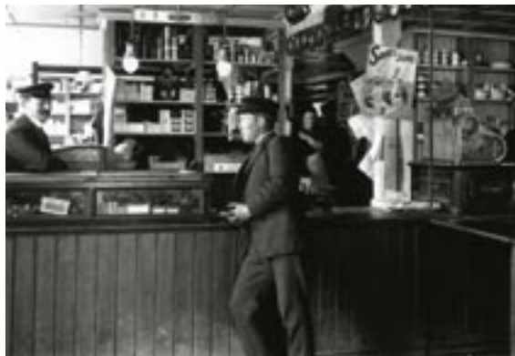
Verslun í Reykjavík um aldamótin 1900.

Opinber afskipti af verslun voru miklu minni á tímabilinu 1855–1914 en síðar varð. Menn gátu hafið verslunarrekstur ef þeir voru handhafar borgarabréfs en þeim bar einnig að reka þessa verslun inni á löggilttri verslunarlóð. Verðlagsákvæði voru hverfandi, samkeppnin sá um slíkt,