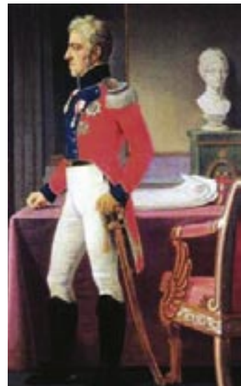
Fríðrik VI Danakonungur.