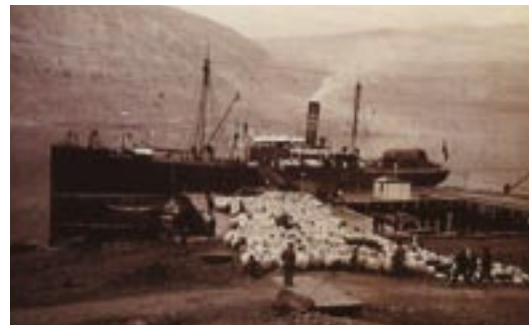
Útskipun á sauðfé til Englands.

Markmið þessara verslunarfélaga var að bjóða betri verslunarkjör en kaupmenn gerðu, hvort sem það var gert með söfnun vörupantana og loforðum um afurðir til endurgjalds eða með sölu hlutabréfa. Íslendingar höfðu því um 1880 nokkra reynslu af óformlegum verslunarsamtökum og hlutafélögum auk einstaklingsverslunar. Á síðari hluta 19. aldar tóku landsmenn að selja búfé á fæti úr landi, hross um 1850 og sauðfé fyrst árið 1866. Talið er að á 19. öld hafi samtals 62.398 hross verið flutt úr landi og seld fyrir samtals rúmlega þrjár milljónir króna. Útflutningur á sauðfé var lítill framman af en stórkjóst um 1880 og eftir það voru 10.000 til 60.000 kindur seldar úr landi árlega til ársins 1896.