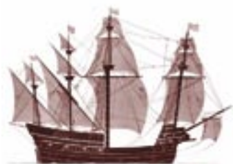
Enskt skip frá miðöldum.

Íslenskar heimildir geta fyrst um ensk skip við landið árið 1412 en sigling Englendinga til landsins kann að hafa hafist litlu fyrr. Englendingar höfðu þá um hríð siglt til Björgvinjar og hafa vafalítið fræðst þar um útflutningsvörur Íslendinga. Víst er